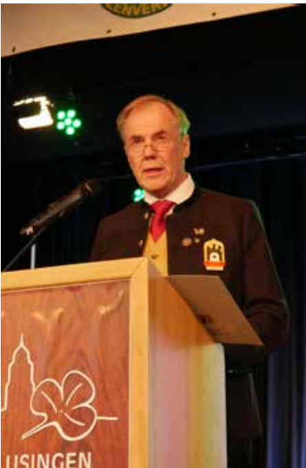
Hans-Heinrich von Schönfels, Präsident des Deutschen Schützenbundes und Ehrenpräsident des Hessischen Schützenverbandes