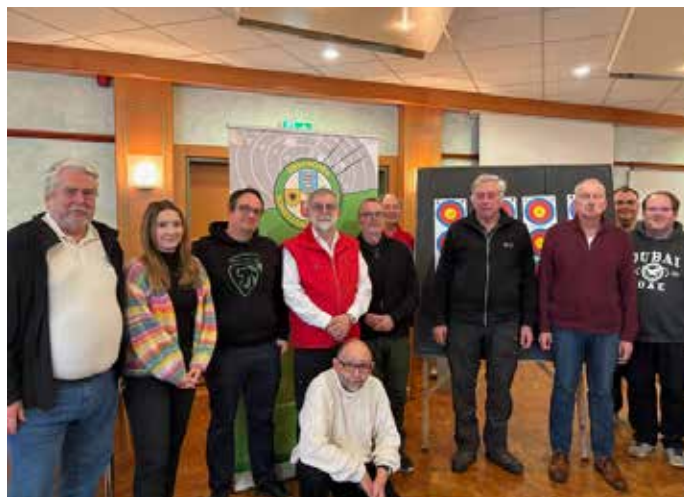
Die Teilnehmer der Fortbildung Kampfrichter-Bogen im Februar in Frankfurt.