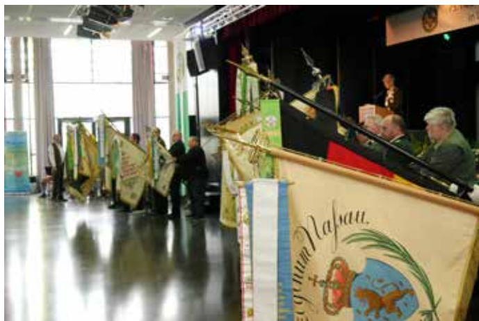
Während der Totenehrung wurden die Fahnen aus Respekt vor den Verstorbenen gesenkt.

In seinem Grußwort hob der Usinger Bürgermeister Steffen Wernard die Bedeutung des Schützenwesens für die Region hervor. Er dankte den Verantwortlichen des Hessischen Schützenverbandes ausdrücklich für das entgegengebrachte Vertrauen, den Hessischen Schützenntag bereits zum dritten Mal in der mittelgroßen Stadt Usingen auszurichten. Wernard betonte, dass eine Veranstaltung dieser Größenordnung nur durch das unermüdliche Engagement der Ehrenamtlichen in den Vereinen realisierbar sei. Für ihn persönlich markierte dieser Tag auch das Erreichen eines wichtigen Ziels seiner Amtszeit, wobei er den Blick bereits nach vorne richtete, und den Wunsch äußerte, künftig auch den Hessentag nach Usingen zu holen.