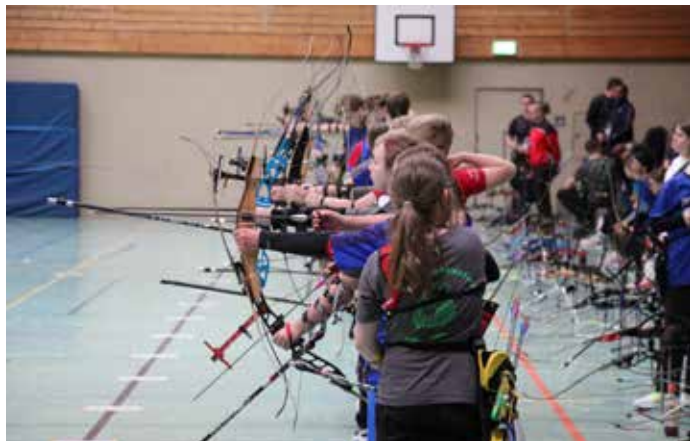
Ein Blick auf die Schießlinie bei den Bogen-Wettkämpfen in Homberg/Efze.

Ein Wochenende im Zeichen des Bogensports: Am 28. und 29. März 2026 verwandelte sich Homberg/Efze zum Zentrum des nationalen Nachwuchssports. Beim Schulvergleich Bogen Halle und dem Shooty Cup Bogen stellten junge Talente aus dem gesamten Bundesgebiet ihr Können unter Beweis. Trotz Zeitumstellung und frostiger Temperaturen zeigten sich die hessischen Teilnehmer in Bestform und sicherten sich zahlreiche Podestplätze – insbesondere in der Einsteigergruppe des Schulvergleichs.