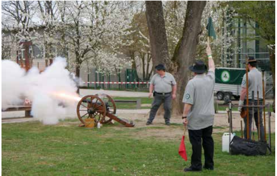
Weithin hörbar wurde der Beginn des Landesschützenballs mit Böllerschüssen signalisiert.