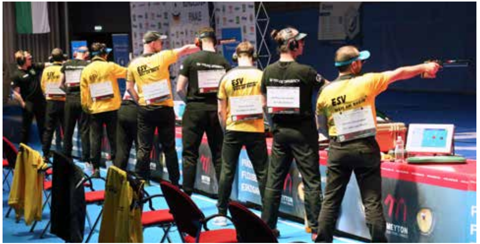
Blick in den Wettkampf zwischen SV Falke Dasbach und ESV Weil am Rhein.

Über den gesamten Wettkampfverlauf führte der SV Kriftel in den Zwischenständen, doch zunächst stand das Spitzenduell