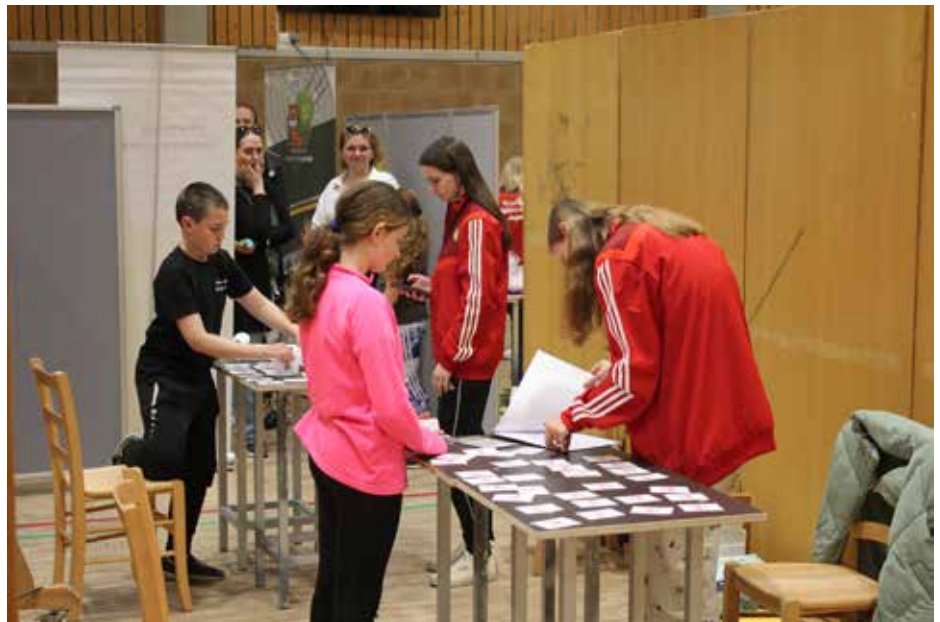
An der Station „Memory“ konnten die jungen Teilnehmerinnen und Teilnehmer ihre Konzentrationsfähigkeit beweisen.