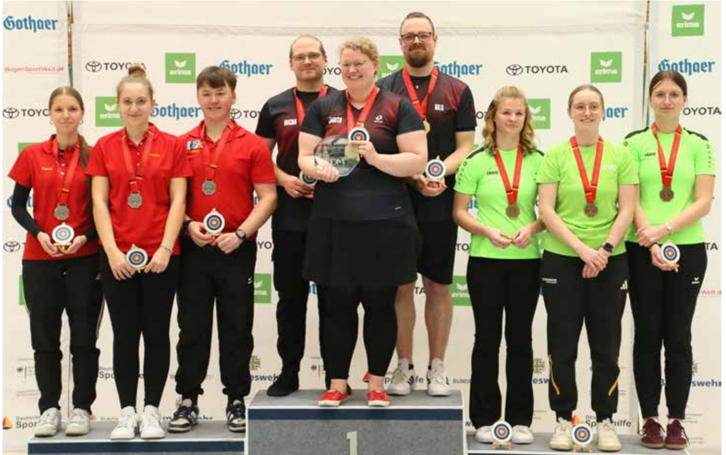
Die Erstplatzierten Recurvebogen-Teams (von links): SV Böddiger, BSV Moischt und BSC BB Berlin.