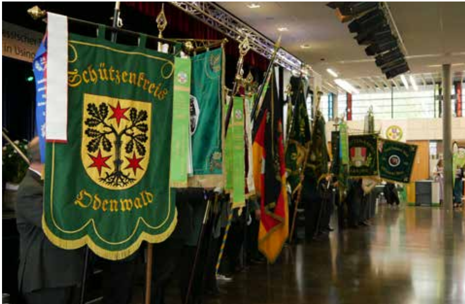
Der Fahneneinzug im Rahmen des Schützenballs gab ein eindrucksvolles Bild ab. Neben den Fahnen von Vereinen und Bezirken wurden auch die Fahnen einiger ehemaliger Schützenkreise in den Saal getragen.

durch sein Engagement als Trainer der hessischen Sommerbiathlon-Auswahl.