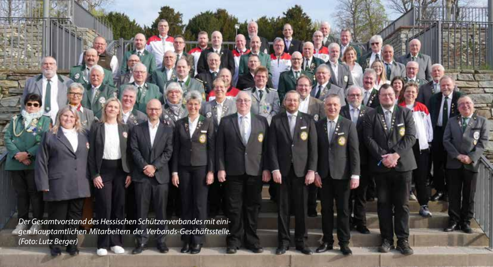
Der Gesamtvorstand des Hessischen Schützenverbandes mit einigen hauptamtlichen Mitarbeitern der Verbands-Geschäftsstelle.