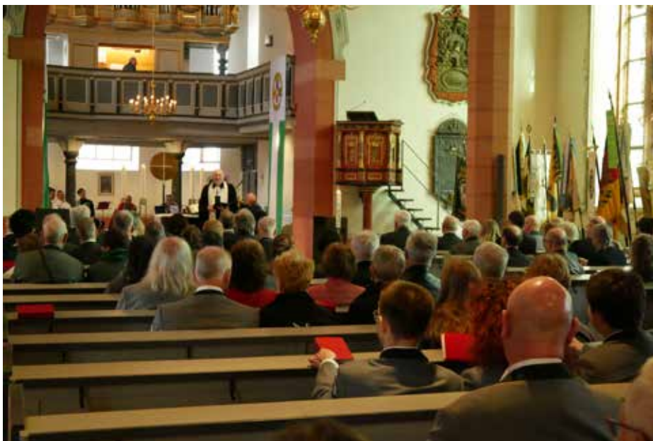
Der Festgottesdienst in der evangelischen Laurentiuskirche in der Usinger Altstadt leitete am Samstag zum Abendprogramm über.

Das Ziel des Zuges bildete die barocke Laurentiuskirche in der Usinger Altstadt, die den würdigen Rahmen für den anschließenden Festgottesdienst bot. In dem prachtvollen Kirchenschiff fanden die Teilnehmer Ruhe und Besinnung, während der Posaunenchor der evangelischen Kirchengemeinde für die musikalische Untermalung sorgte. Dieser geistliche Abschluss des Nachmittags verband die festliche Dynamik des Umzugs mit einem Moment der Einkehr und unterstrich die tiefe Verwurzelung des Schützenwesens in der regionalen Kultur und Geschichte.