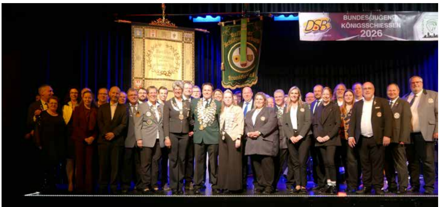
Die hessische Delegation beim Bundeskönigsschießen 2026 in Frankfurt am Main.