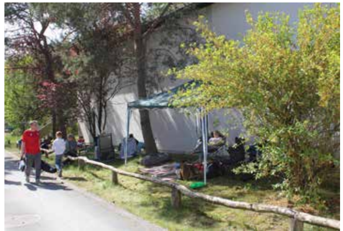
Einige Vereine hatten eigene Pavillions mitgebracht und verbrachten den Tag bei bestem Wetter im Freien.