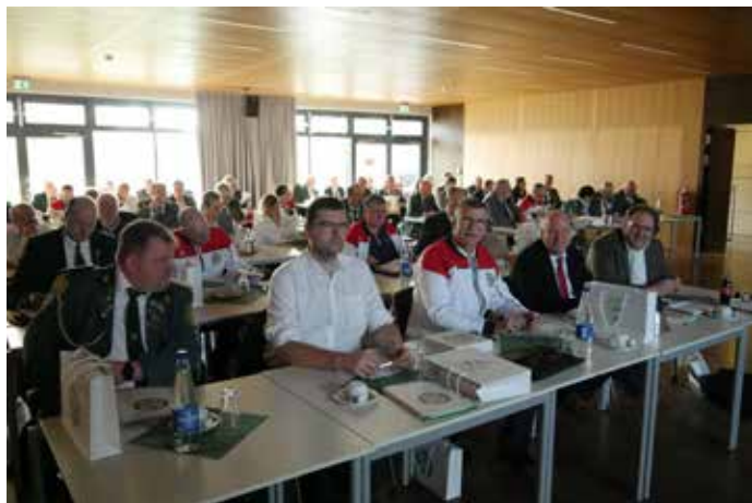
Ein Blick auf die Teilnehmer der Gesamtvorstandssitzung auf dem Hessischen Schützentag in Usingen.