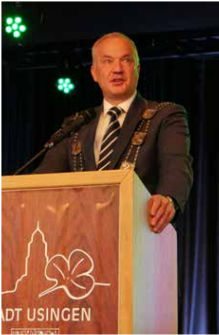
Steffen Wernard, Bürgermeister von Usingen