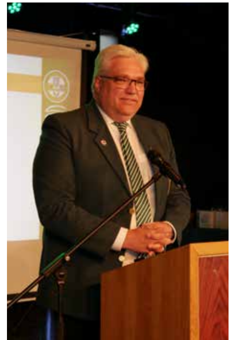
Maik Hollmann, Präsident des Westfälischen Schützenbundes