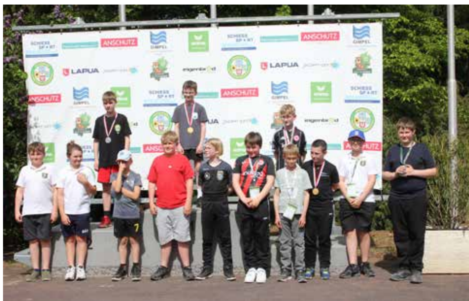
Zahlreiche Sieger wurden bei den Jugendmeisterschaften „Faszination Lichtschießen“ ausgezeichnet.

Am Samstag, den 2. Mai 2026, fanden in unserem Landesleistungszentrum in Frankfurt am Main die Hessischen Jugendmeisterschaften „Faszination Lichtschießen“ statt – und was für ein Tag das war! Bei strahlendem Wetter und ausgezeichnete Stimmung gingen über 120 junge Schützinnen und Schützen an den Start.