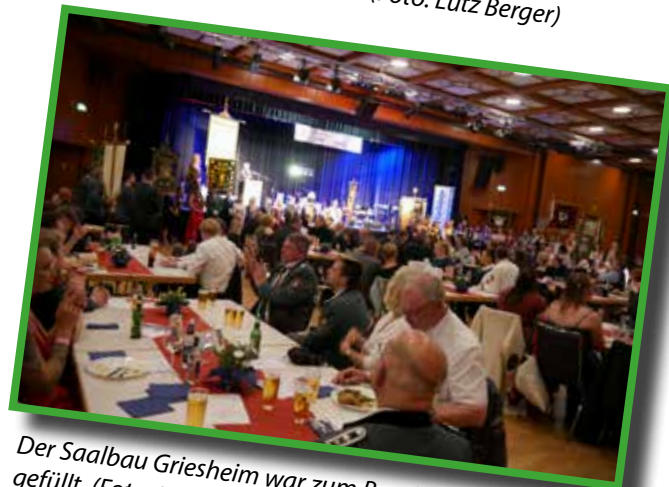
Der Saalbau Griesheim war zum Bundesschützenball gut gefüllt.