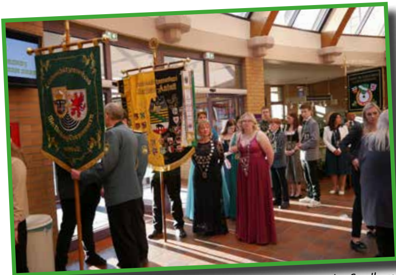
Die Schützenköniginnen und -könige stellten sich im Foyer des Saalbaus zum feierlichen Einzug auf.