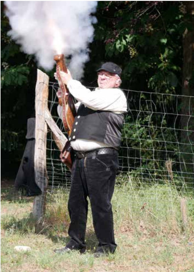
Die Böllerguppe Hessen eröffnete das Bundeskönigsschießen.